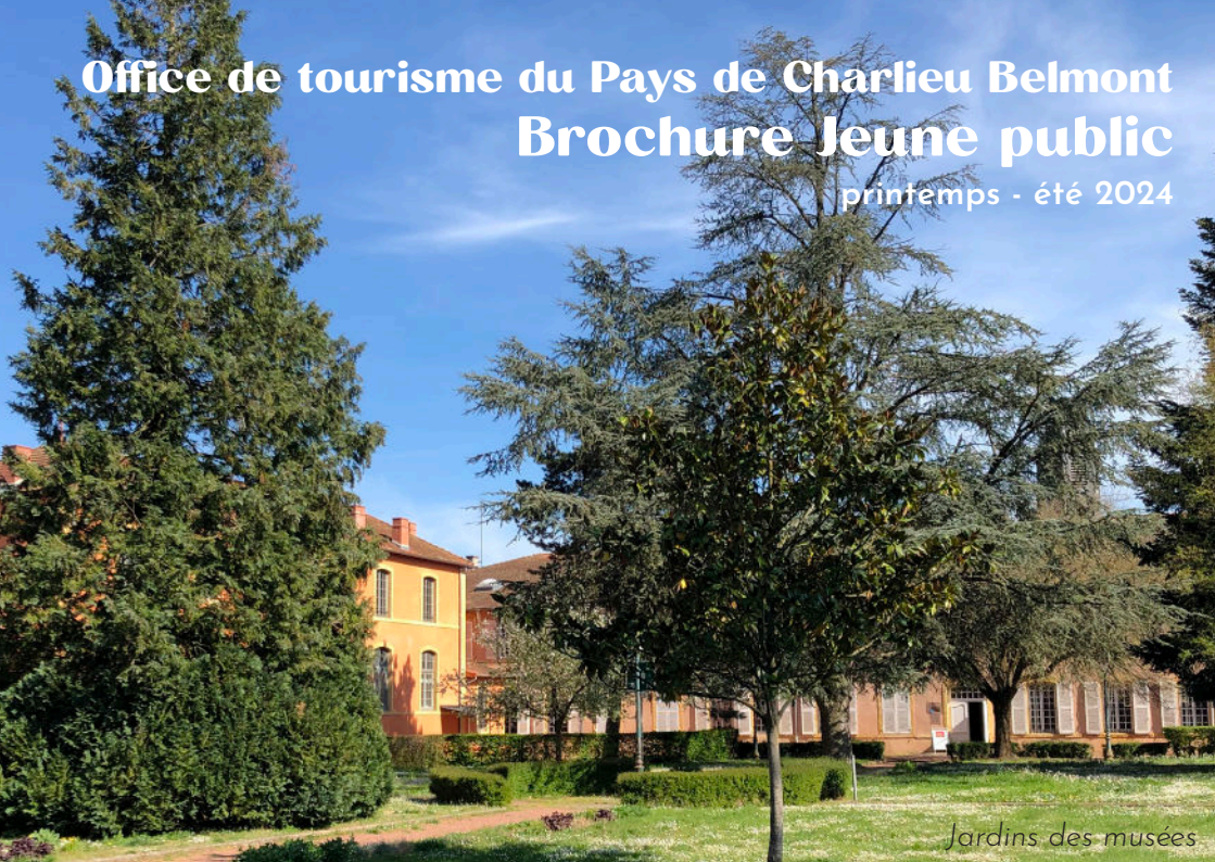
Jardins des musées